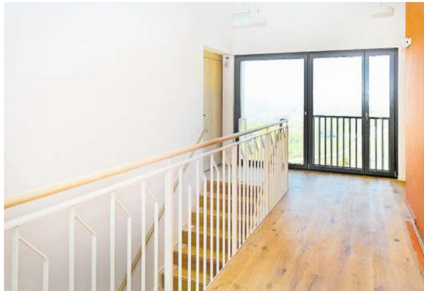
Blick vom Treppenhaus im Obergeschoss hinaus in die Landschaft.

Ein Teil des Erdgeschosses blieb bestehen und wurde mit dem Neubau erweitert und überbaut. Dort befinden sich jetzt neben dem Empfang und dem Sekretariat ein Mehrzweckraum für Ak-