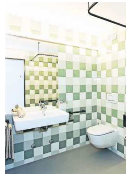
Jedes Zimmer hat eine eigene Nasszelle.