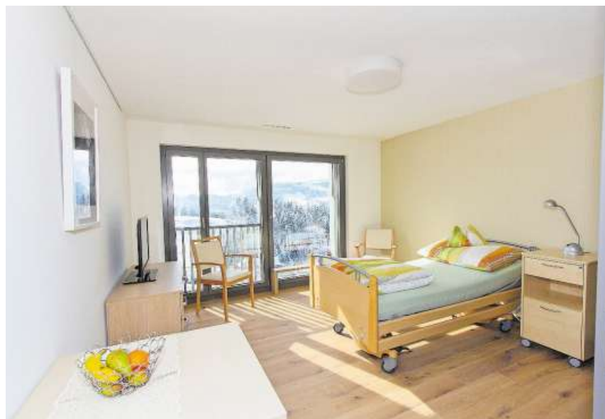
Lichtdurchflutete und geräumige Zimmer sorgen für ein wohnliches Ambiente.