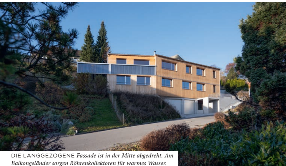
DIE LANGGEZOGENE Fassade ist in der Mitte abgedreht. Am Balkongeländer sorgen Röhrenkollektoren für warmes Wasser.