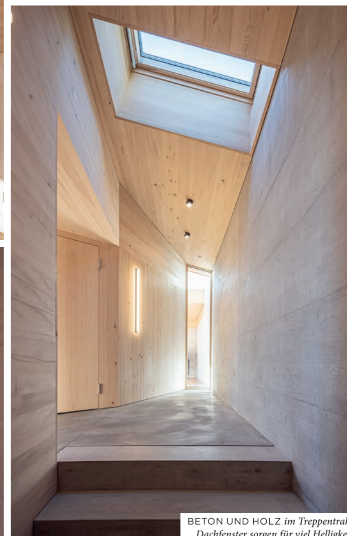
BETON UND HOLZ im Treppentrakt. Dachfenster sorgen für viel Helligkeit.

haus. Das ebenerdige Sockelgeschoss ist in Massivbauweise mit Beton gebaut. Es bietet Platz für eine grosszügige Garage und die Haustechnik.