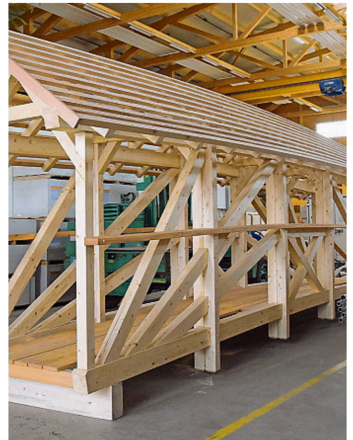
Nur noch die Glasplatten an den Seiten und die Dacheindeckung fehlen.

aber nur wenig unterstützen müssen. «Das meiste haben sie selbständig gelöst», so Gantenbein. Doch an der Holzbrücke sind nicht nur Zimmermann-